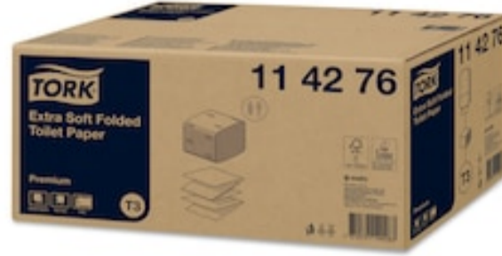
Tork Folded Toilet Paper Prem ES 2p 252s 114276