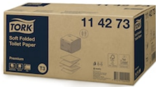
Tork Folded Toilet Paper Prem 2p 252s 114273